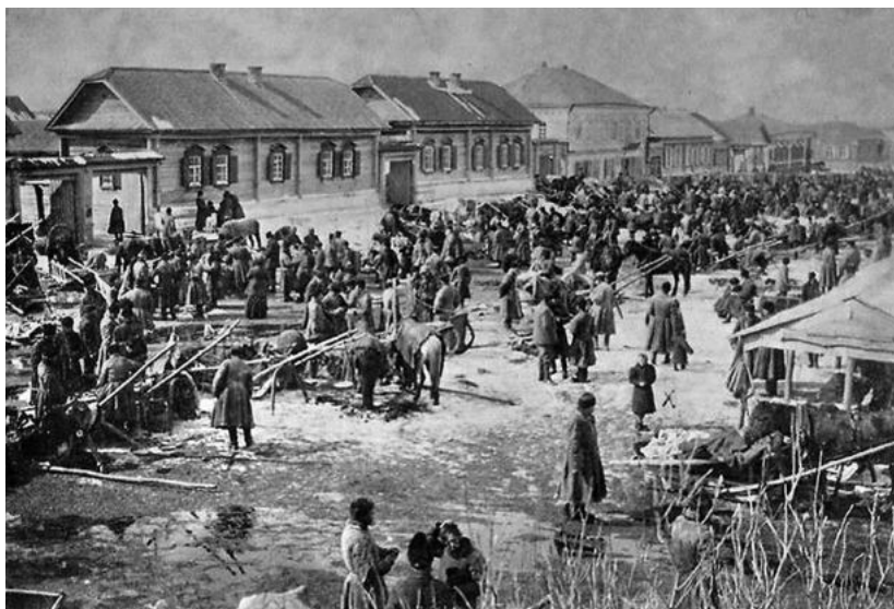
Колония Гримм. Саратовская губерния