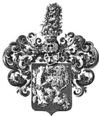
Герб семьи Гримм