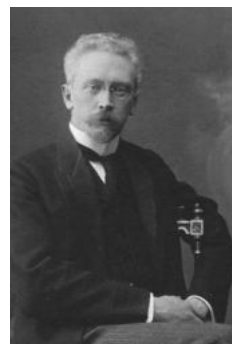
Эрвин Давидович Grimm. Фотография публикуется впервые

Третий сын академика архитектуры, Эрвин Давидович Grimm , сразу после окончания школы К. Мая, в 1887 г., поступил на историко-филологический факультет ИСПБУ 47 . В 1891 г. после окончания университета был оставлен для приготовления к профессорскому званию на кафедре всеобщей истории. Основным направлением его научной деятельности была история Западной Европы, преимущественно Римской империи. Параллельно с университетской практикой преподавал историю в знаменитой Петришуле 48 . В 1896–1898 гг. служил приват-доцентом в Казанском университете, после чего вернулся в Петербург, где с 1899 г. занимал должность приват-доцента ИСПБУ, профессора всеобщей истории ИСПБУ и одновременно преподавал на Высших женских (Бестужевских) курсах 49 . С 1900 г. – магистр и с 1902 г. – доктор всеобщей истории, с 1907 г. – ординарный профессор кафедры всеобщей истории ИСПБУ. В 1911 г. был избран ректором университета – принял этот пост от своего