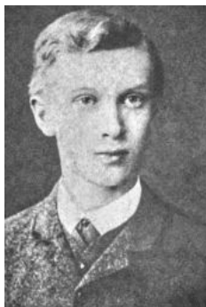
Эрвин Давидович Гримм, профессор всеобщей истории Императорского Санкт- Петербургского университета

старшего брата и вплоть до 1918 г. оставался на этой должности. Когда в соответствии с принятым в 1918 г. декретом «Об отделении церкви от государства и школы от церкви» стали закрываться домовые храмы в учебных заведениях, именно благодаря заступничеству ректора университета Э. Д. Гримма закрытие университетской церкви оттянулось на год. В октябре 1918 г., отказавшись от должности ректора «по болезни» , уехал на юг России. Входил в правительство П. Н. Врангеля, с марта 1919 г. – заместитель начальника ОСВАГа 50 . Был эвакуирован в начале 1920 г. из Новороссийска в Салоники 51 , позднее перебрался в Болгарию, где возглавил кафедру всеобщей истории Софийского университета. С 1922 г. – член Союза возвращения на родину. В конце 1923 г. вернулся в СССР, жил в Москве. С 1924 г. – консультант НарКомата иностранных дел, участвовал в подготовке к изданию ряда документов по истории международных отношений. С 1930 г. жил в Ленинграде, работал в Объединении государственных книжно-журнальных издательств, затем – в Библиотеке АН.