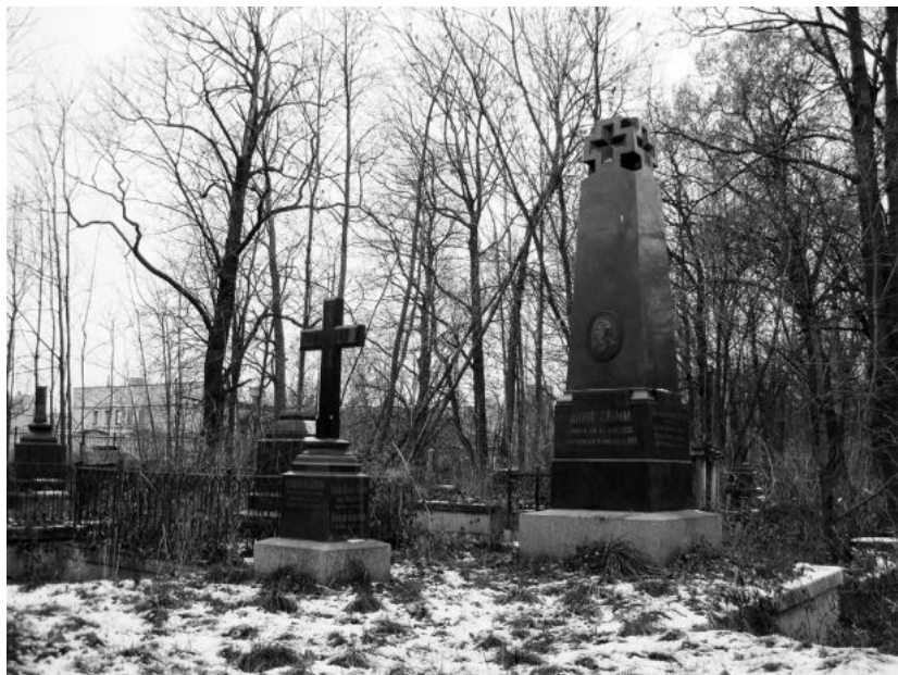
Смоленское лютеранское кладбище. Семейная усыпальница семьи Гримм.